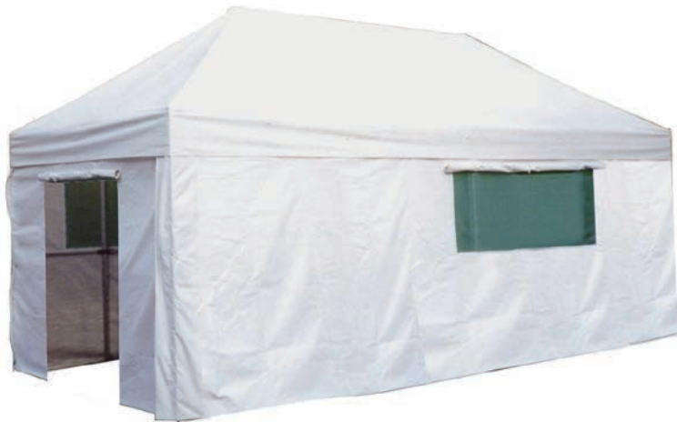
◀両側に巻上式窓 出入口は巻上式。