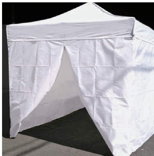
◀出入口はチャック式。 (両側の窓は無し。)