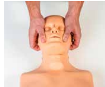
▲下顎挙上法による人工呼吸訓練ができます