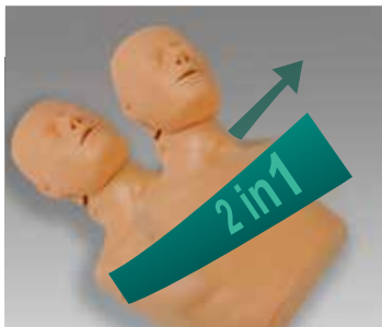
▲1体で成人用/小児用訓練が可能