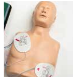
▲AEDパッドを貼っても接着剤が残りにくい