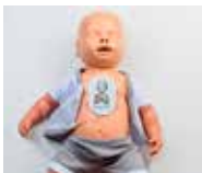
▲AEDパッドを貼っても接着剤が残りにくい