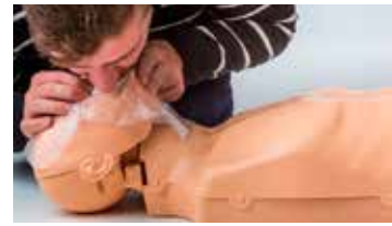
※フェイスシールドは構成品に含まれません