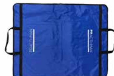
▲収納バッグ (マット付) を広げた状態