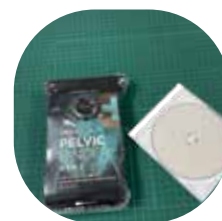
コンパクトなパッケージ (CDは付属しません。- 大きさ比較用)