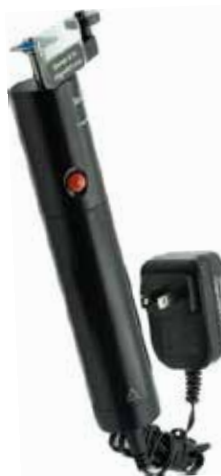
▲ACタイプ本体と付属のアダプター