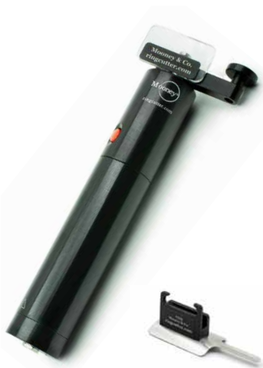
▲電池タイプ本体と付属の フィンガーガード